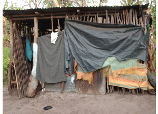
Dos de las seis casas de las familias que están siendo beneficiadas por el proyecto