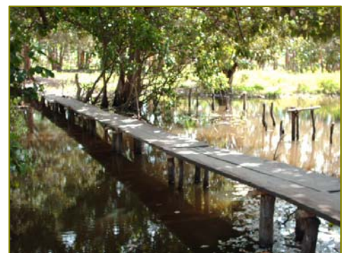
Puente de acceso a El Porvenir

Compuesta por once familias que trabajan como pescadores, la comunidad no dispone de luz eléctrica, viven en casas de madera y plástico, y debido a las inundaciones del camino es muy frecuente la intermitencia de los niños en la asistencia a la escuela.