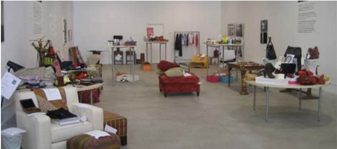
Local donde tuvo lugar el mercadillo y la subasta

Véase en youtube: http://www.youtube.com/watch?v=pIwuXI606hc