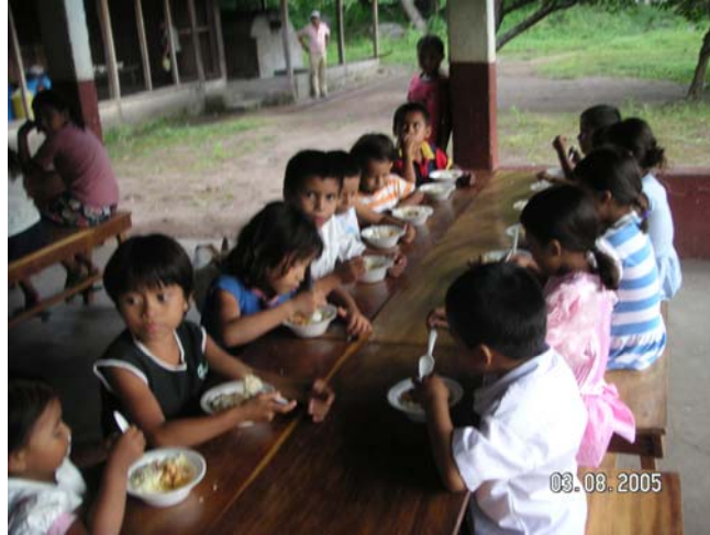
Comedor de Agua Agria