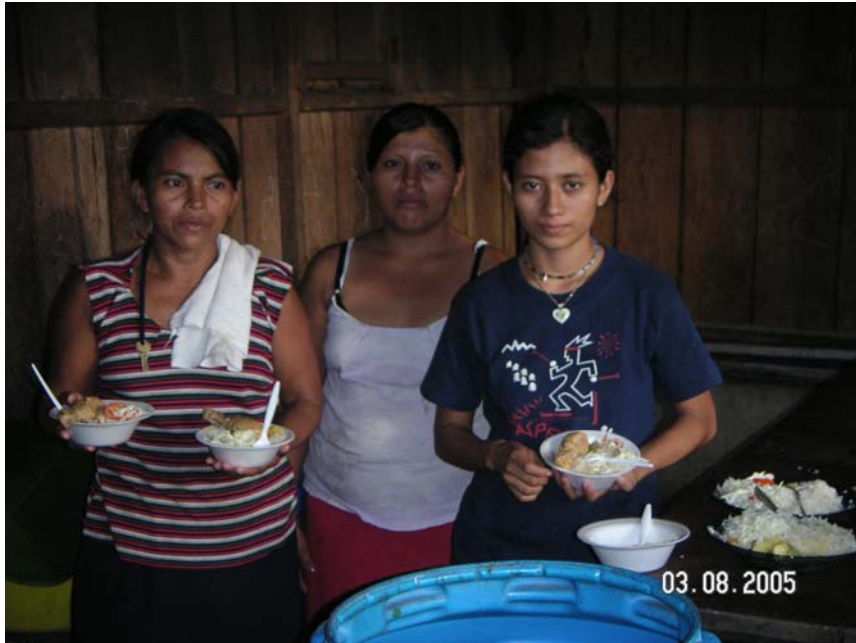
Madres participando en el comedor