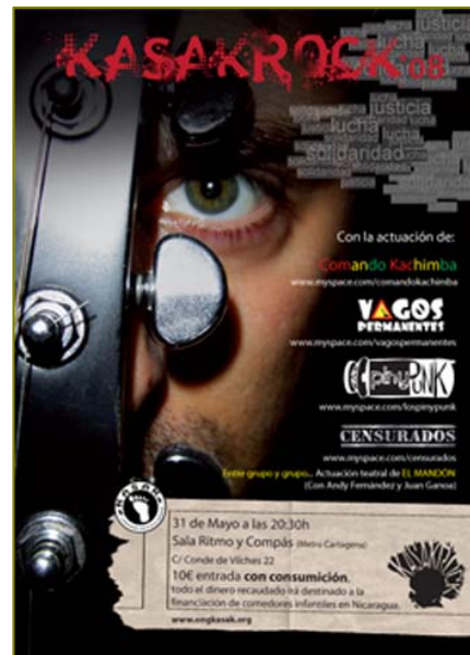
Cartel del concierto

En 2007 se han llevado a cabo diferentes eventos tanto para recaudar fondos como para darnos a conocer. En Junio llevamos a cabo nuestro festival anual de música solidaria: KasakRock . Este año organizamos la tercera edición de un festival que ya se caracteriza por hacer posible que los comedores de varias zonas rurales de la ciudad de Granada, Nicaragua sigan adelante. Creemos que a través de conciertos con trasfondo social se puede conseguir que la gente se implique y comprometa un poco más en la tarea de crear un mundo más justo.