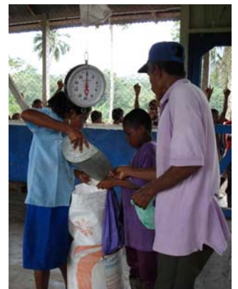
Reparto de la ayuda recibida