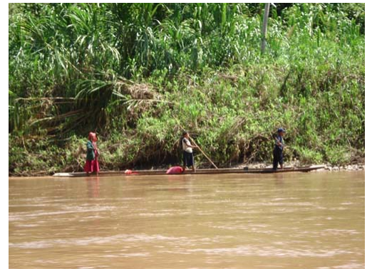
Viaje en balsa a Raití

No disponen de agua potable, luz, asistencia médica, ni recursos educativos.