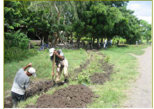
Zanjeo de la tierra

Para la construcción de la tubería se contrató a trabajadores de la comunidad de Tepalón, con lo que esta comunidad se vio por tanto beneficiada directamente a partir de la generación de empleo, que aunque no de manera permanente, supuso un ingreso extra en sus familias.