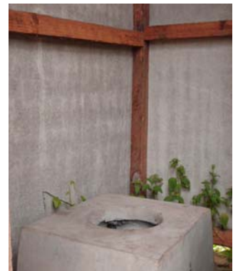
Modelo de letrina

Compuesta por 91 familias, con un total de 393 habitantes, en la comunidad el 65.9% tiene agua potable, el 26.2% tiene energía eléctrica en sus casas. El 34.1% no posee agua potable, y el 53.8% que no poseen energía eléctrica. El 38.5% de la población posee letrinas en uso, un 11.0% las tiene casi llenas, y un 50.5% carece de las mismas.