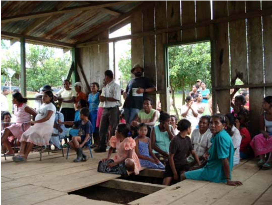
Reunión de la comunidad

Los miembros de la comunidad se comprometieron a conformar una Directiva que coordinase las reuniones de la comunidad, para llegar a un compromiso mayor y, sobre todo, a una mayor organización y trabajo por el beneficio común de la zona.